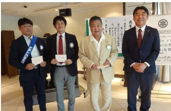
↑左より 岩館会員、宮本会員、長谷部会員