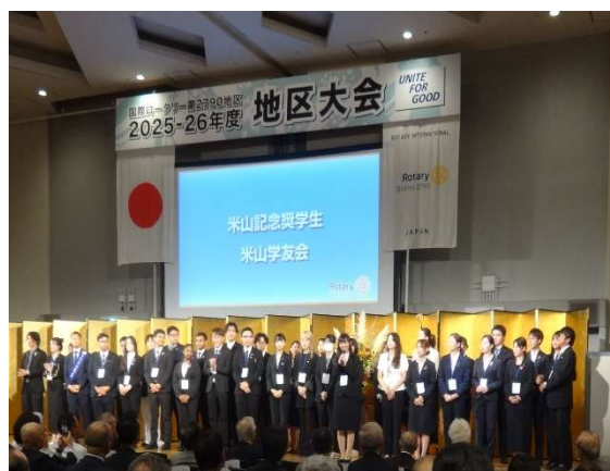
米山記念奨学生の紹介