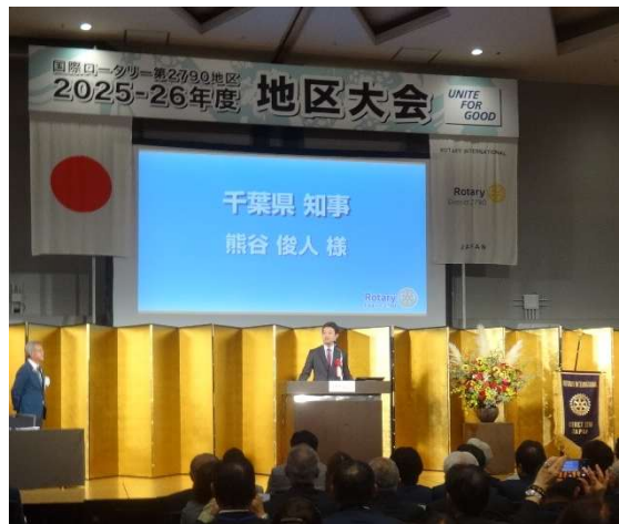
来賓祝辞 千葉県知事 熊谷 俊人 様