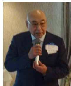
ラオスピエンチャン、クサンパス小学校本寄贈

ラオスについては、地区補助金を使って約10年強、10回以上の支援を行ってきました。